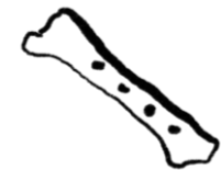
Os amb forats