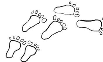
Petjades petites en forma de cercle