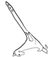
Propulsor de llança amb decoració d'un cervatell fent caca