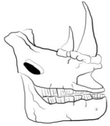
Crani de rinoceront