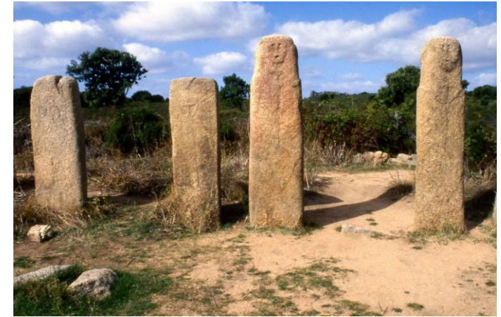
Estates-menhir de Stantari (Córcega)