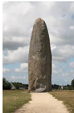
Menhir de Champ-Dolent (Bretanya)