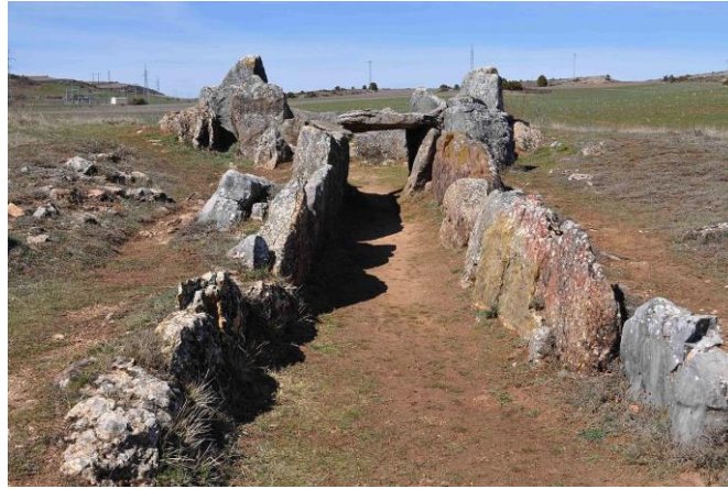
Dolmen de Cubillejo de Lara (Castella i lleó)