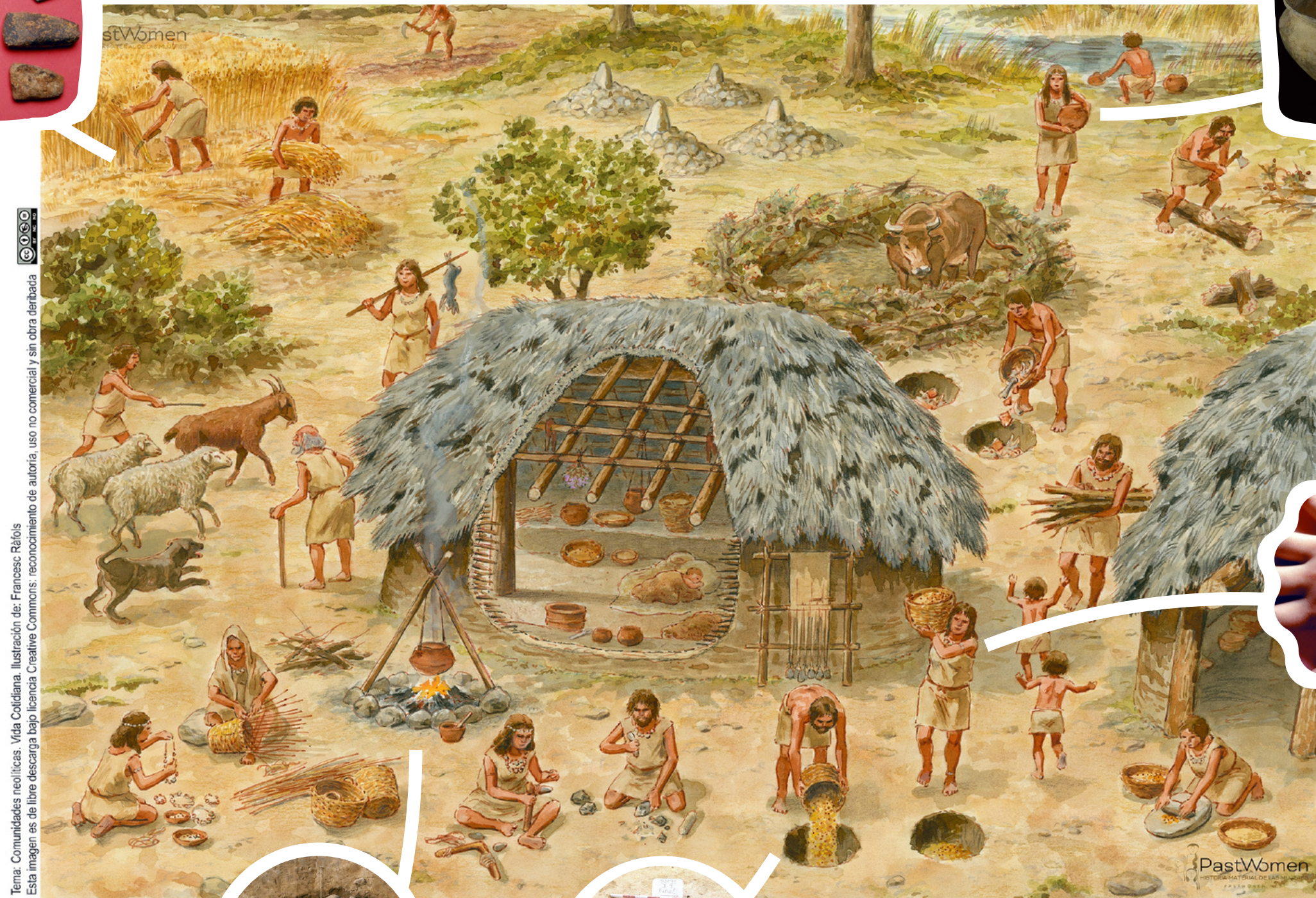
Tema: Comunitats neolítiques. Vida Cotidiana. Il·lustració de: Francesc Ràfols. Esta imagen es de libre descarga bajo licencia Creative Commons: reconocimiento de autoría, uso no comercial y sin obra derivada

Il·lustració de Francesc Ràfols (web de PastWomen). Fotografies del registre arqueològic del jaciment Bóbila Madurell (CEPAP-UAB, web de PastWomen), del jaciment d'El Mirador (IPHES-CERCA) i del Molí del Salt (IPHES-CERCA).