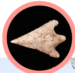
Punta de fletxa

Es realitzen les primeres pintures (representen els animals que veien o plasmen les seves mans), i els primers ornaments (amb coses que recollien, com ara petxines o ullals).