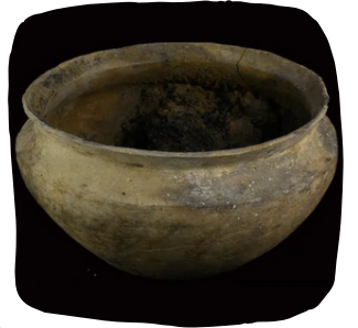
Vas de ceràmica