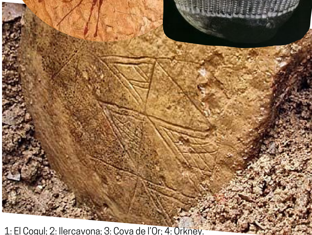
1: El Cogul; 2: Ilercavona; 3: Cova de l'Or; 4: Orkney.