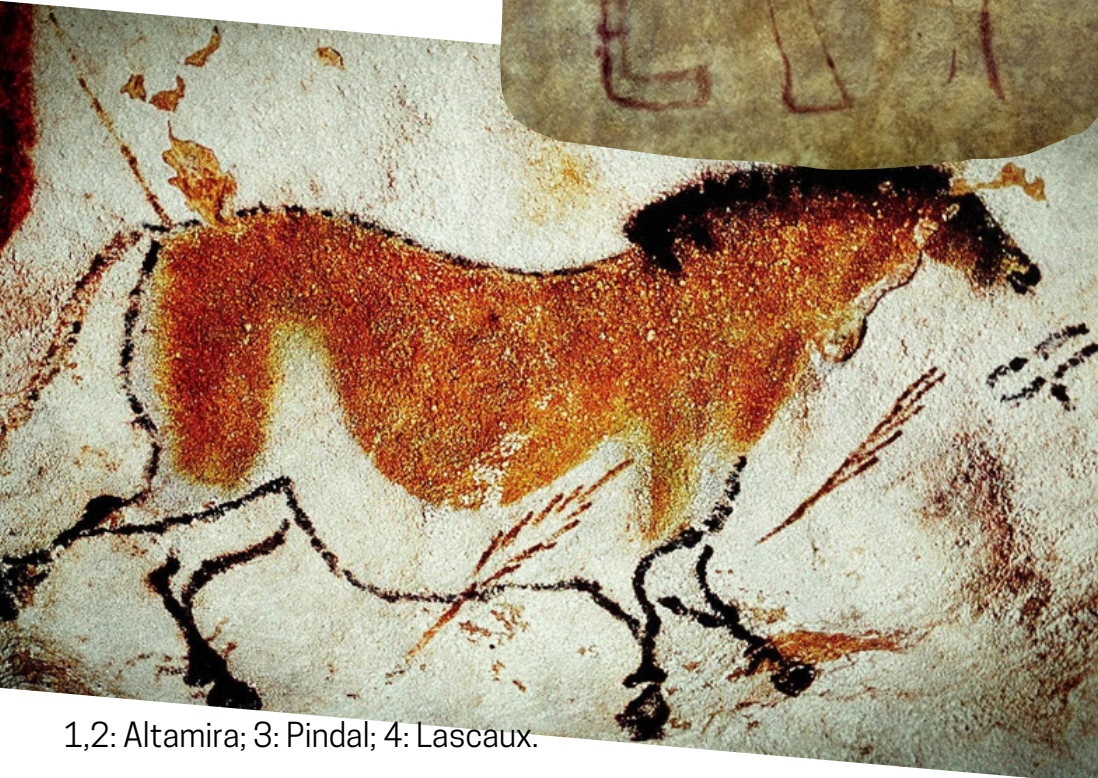
1,2: Altamira; 3: Pindal; 4: Lascaux.