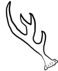
Cuerno de ciervo