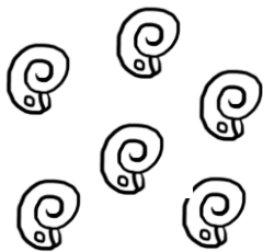
Conchas perforadas con una herramienta