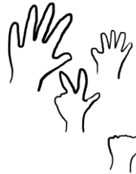
Manos de diferentes medidas pintadas en la pared