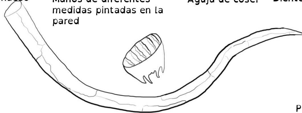
Colmillo y diente de mamut