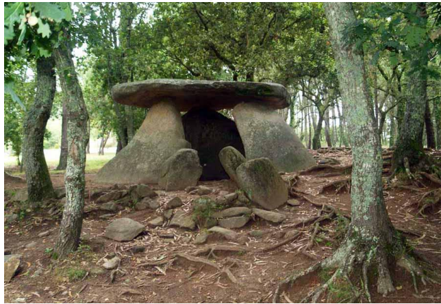
Dolmen Axeitos (Galicia)