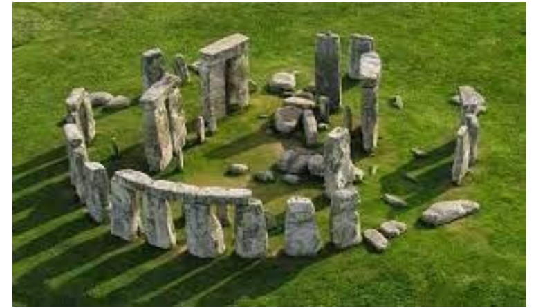
Stonehenge (Reino Unido)