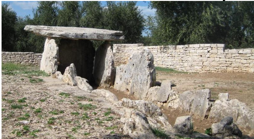
Dolmen La Chianca (Italia)