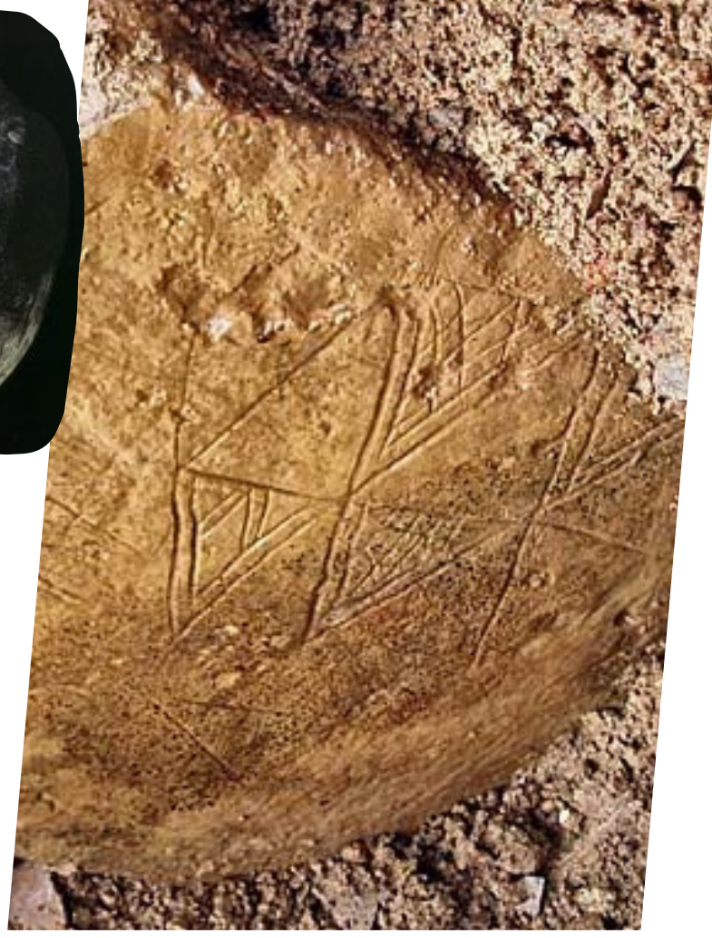
1: El Cogul; 2: Illeceavona; 3: Cova de l'Or; 4: Orkney.