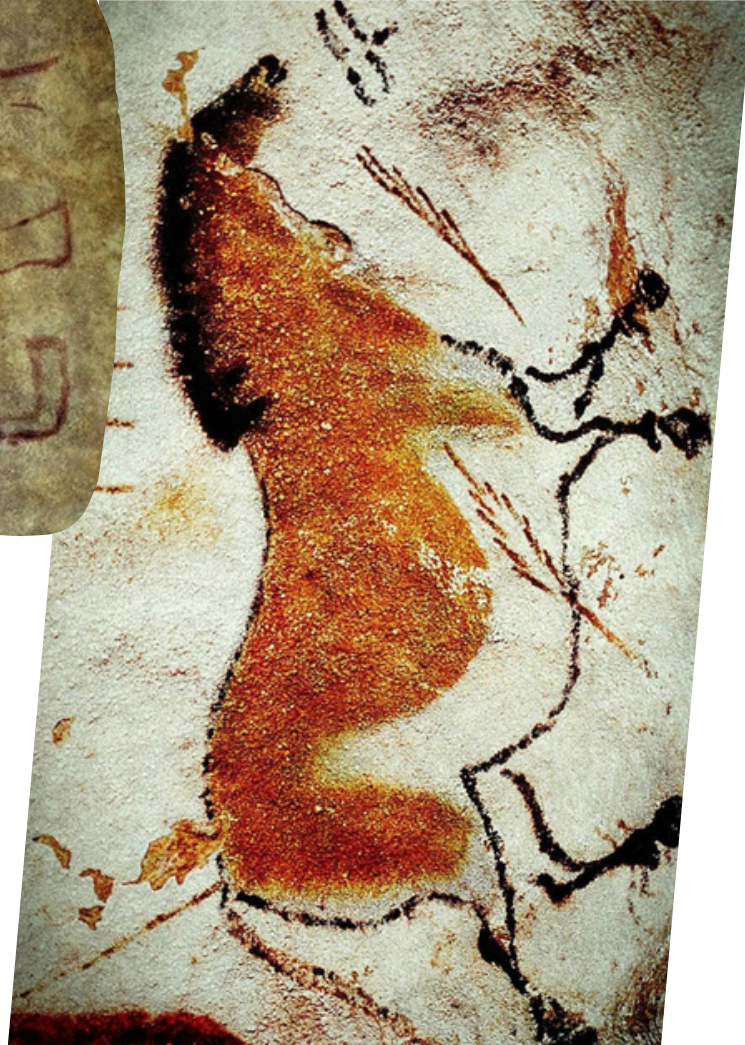
1,2: Altamira; 3: Pindal; 4: Lascaux.

En el neolítico los grupos humanos continúan dibujando los animales , pero también grupos de humanos haciendo actividades y símbolos abstractos. Lo hacen con ocre y con otros pigmentos que van descubriendo. También decoran la cerámica , que empiezan a fabricar.