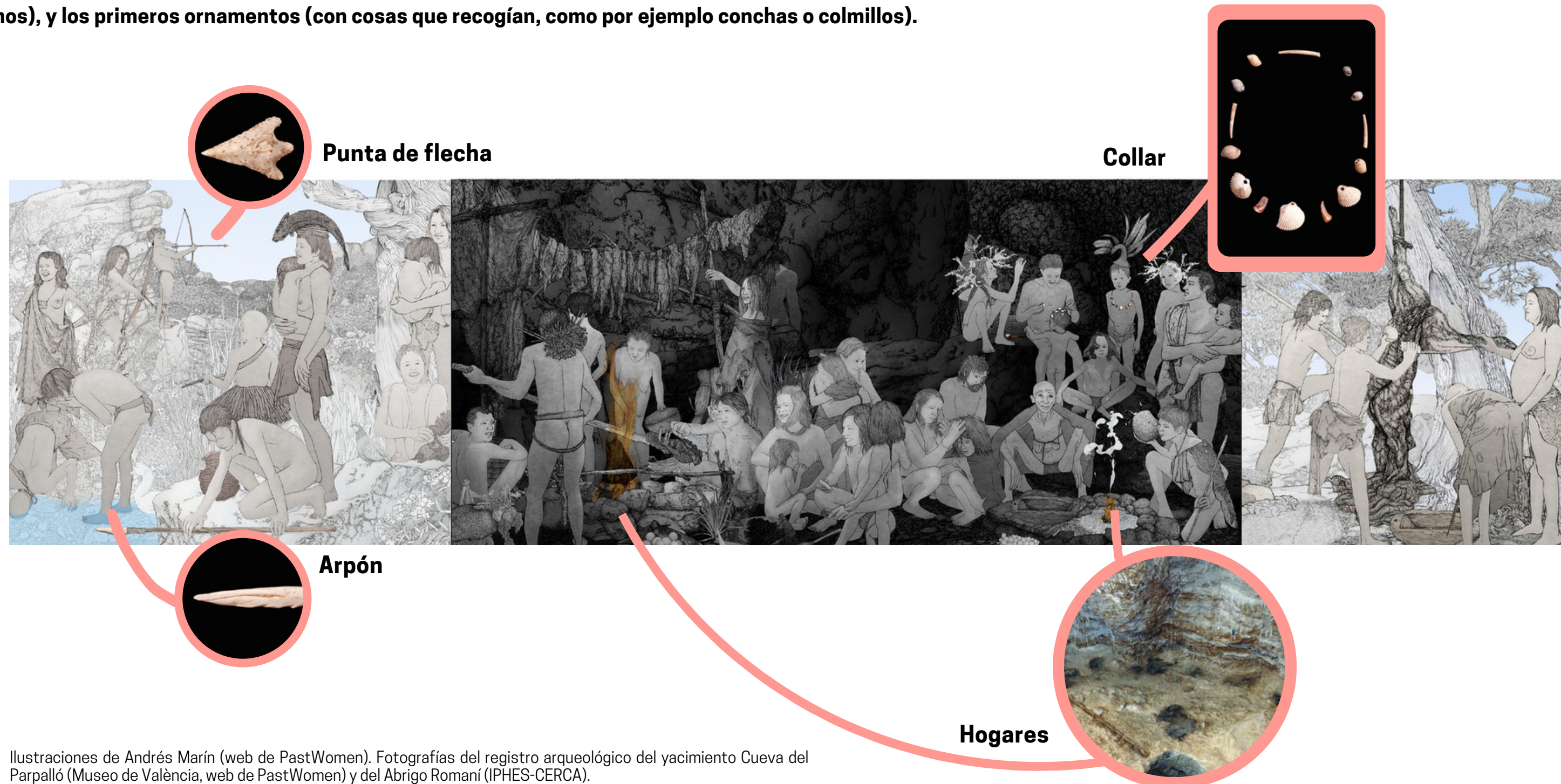
Ilustraciones de Andrés Marín (web de PastWomen). Fotografías del registro arqueológico del yacimiento Cueva del Parpalló (Museo de València, web de PastWomen) y del Abrigo Romani (IPHES-CERCA).

Durante el paleolítico, se generaliza el uso del fuego que permite cocinar alimentos y facilita la reunión. Se realizan las primeras pinturas (representan los animales que veían o plasman sus manos), y los primeros ornamentos (con cosas que recogían, como por ejemplo conchas o colmillos).